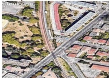
La halte Galliéni-Cancéropôle de Toulouse réalisée en 2009 (à g.). Deux quais sont situés du même côté de la voie ferrée, de part et d'autre du passage à niveau.