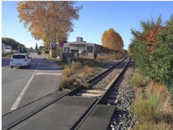
Un projet similaire à celui demandé par le Carrefour citoyen et les Venellois a été accepté par la SNCF à Toulouse.