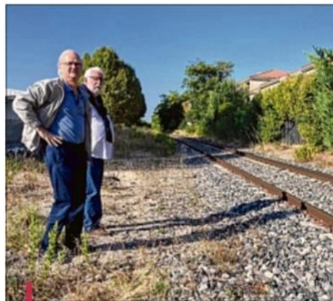
Les membres du Carrefour citoyen, association porteuse de la pétition, espèrent rapidement voir pousser un quai sous leurs pieds.