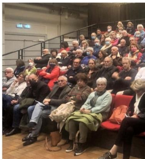
Plus de 80 personnes sont venues dire oui au train à Venelles mercredi dernier. PHOTO DE