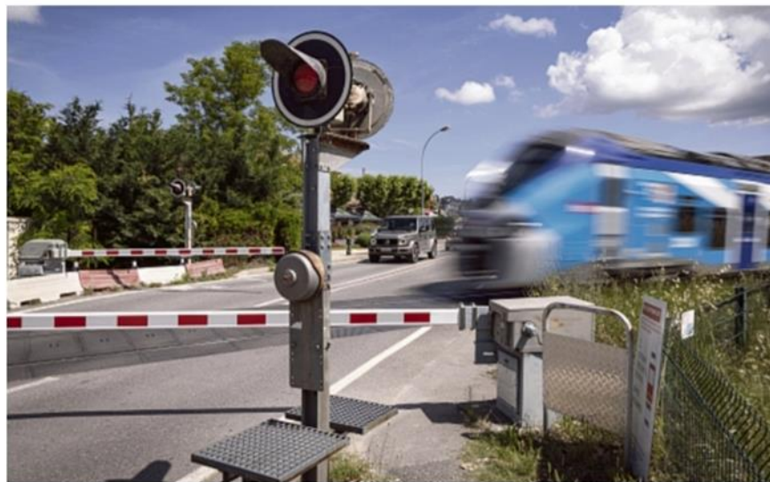
Dix trains par sens et par jour passent à Venelles, la moitié sur Pertuis et l'autre moitié en direction des Alpes.

Pour résumer, trois options sont proposées : un seul quai, mais avec un passage à niveau fermé longtemps, y compris par rapport au rond-point qui est un peu plus loin ; deux quais avec des interrogations sur le 2 e quai qui est en cours et peut être plus difficile à mettre en place ; la 3 e option, un seul quai plus un si-